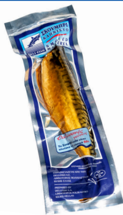
Σκουμπρί καπνιστό ακέφαλο Cold Smoked mackerel Geräucherte makrele Maquereau fumé Sgombro affumicato