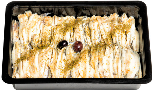
Γαύρος φιλέτο μαρινάτος Marinated anchovy fillets Marinierte Sardellenfilets Filets d'anchois marinés Filetti di alici marinati