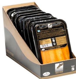
Ρέγγα καπνιστό φιλέτο Cold smoked herring fillet Geräucherte Heringsfilets Filets de hareng fumé Filetti di aringa affumicata