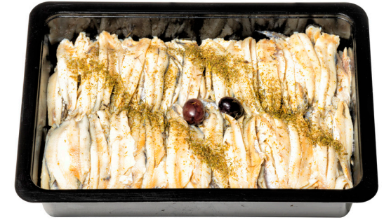
Γαύρος φιλέτο μαρινάτο με σκόρδο Marinated anchovy fillets with garlic Marinierte Sardellenfilets mit Knoblauch Filets d'anchois marinés à l'ail Filetti di alici marinati con aglio