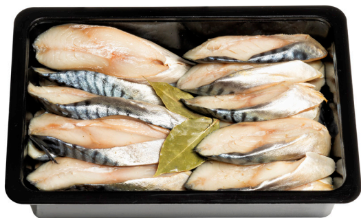
Σκουμπρί φέτα αλατισμένη Salted mackerel slices Gesalzene Makrelenscheiben Tranches de maquereau salées Fette di sgombro salato