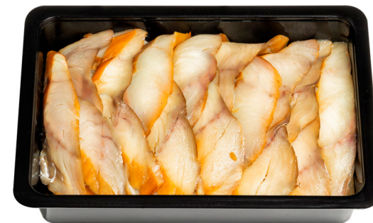
Παστουρμάς θαλάσσης Smoked saithe slices (sea-pastrami) Geräucherte Köhler schein Tranches de lieu noir fumé Fette di merluzzo affumicato