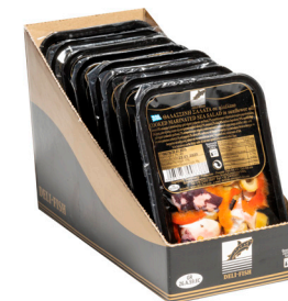
Θαλασσινή σαλάτα Marinated seafood salad Meeresfrüchtesalat Salade de fruits de mer Insalata di mare