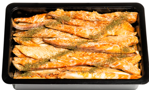
Τσιροσαλάτα καπνιστή Smoked "Tsiros" Geräucherte Makrelenstücke Tranches de maquereau fumé mariné Fette di sgombro affumicato marinato