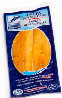
Ρέγγα καπνιστό φιλέτο Cold smoked herring fillet Geräucherte Heringsfilets Filets de hareng fumé Filetti di aringa affumicata