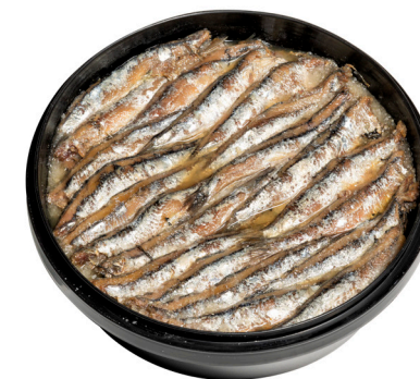
Αντσούγια ακέφαλη παστή σε αλάτι Salted headless anchovy in salt Gesalzene kopflose Anchovies in Salz Anchois sans tête au sel Acciuga senza testa al sale