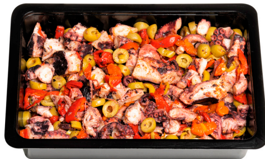
Μαρινάτο χταπόδι σαλάτα Marinated octopus salad Krakensalat Salade de poulpes Insalata di polpi