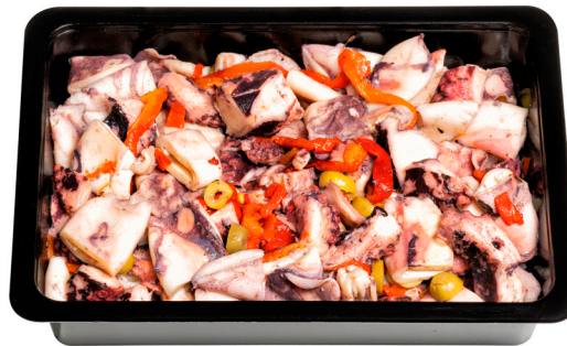
Θαλασσινή σαλάτα Marinated seafood salad Meeresfrüchtesalat Salade de fruits de mer Insalata di mare