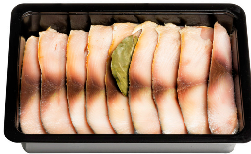
Φιλέτα λακέρδας παλαμίδας Salted bonito slices Gesalzene Pelamidescheiben Lakerda de bonite salée Fettine di bonito salate