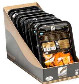
Μαρινάτο χταπόδι σαλάτα Marinated octopus salad Krakensalat Salade de poulpes Insalata di polpi