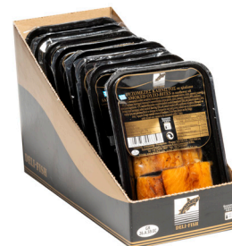
Ουζομεζές καπνιστός Smoked mackerel and herring bites Makrele und Hering, geräucherte Stücke Maquereau et hareng, morceaux fumés Sgombro e aringa, pezzi af- fumicati