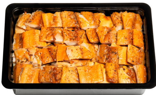
Ουζομεζές καπνιστός Smoked mackerel and herring bites Makrele und Hering, geräucherte Stücke Maquereau et hareng, morceaux fumés Sgombro e aringa, pezzi affumicati