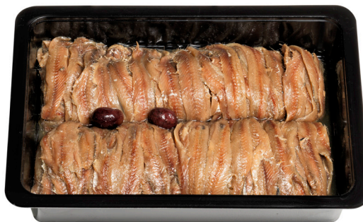
Αντσούγια φιλέτο Salted anchovy fillet Gesalzene Anchoviefillets Filets d'anchois salés Filetto di acciughe salate