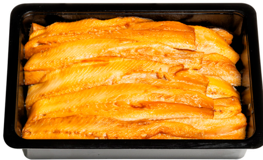
Ρέγγα καπνιστό φιλέτο Cold smoked herring fillet Geräucherte Heringsfilets Filets de hareng fumé Filetti di aringa affumicata