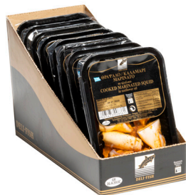
Καλαμαράκι μαρινάτο Marinated squid with parsley Kalmare marinierter Calamar mariné Calamari marinati