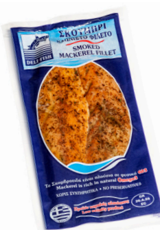
Σκουμπρί καπνιστό φιλέτο Cold Smoked mackerel fillet Geräucherte makrelenfilets Filets de maquereau fumé Filetti di sgombro affumicato