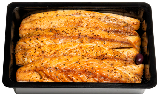
Σκουμπρί καπνιστό φιλέτο Cold Smoked mackerel fillet Geräucherte makrelenfilets Filets de maquereau fumé Filetti di sgombro affumicato