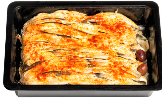
Πικάντικα φιλετάκια γαύρου μαρινάτου Marinated spicy anchovy fillets Sardellenfilets in pikanter Soße Filets d'anchois en sauce piquante Filetti di alici marinati in salsa piccante