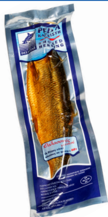
Ρέγγα καπνιστή Cold smoked herring Geräucherte Herings Hareng fumé Aringa affumicata