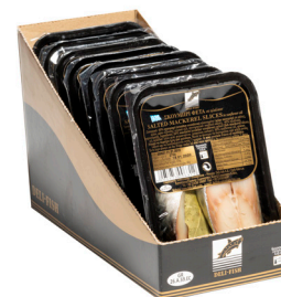
Σκουμπρί φέτα αλατισμένη Salted mackerel slices Gesalzene Makrelenscheiben Tranches de maquereau salées Fette di sgombro salato