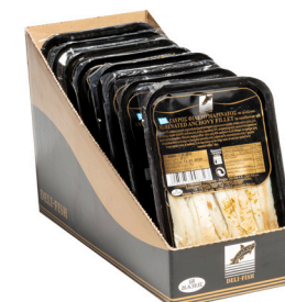
Γαύρος φιλέτο μαρινάτος Marinated anchovy fillets Marinierte Sardellenfilets Filets d'anchois marinés Filetti di alici marinati