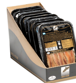
Αντσούγια φιλέτο Salted anchovy fillet Gesalzene Anchoviefillets Filets d'anchois salés Filetto di acciughe salate