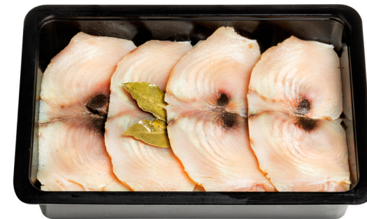
Φιλέτα λακέρδας λευκού τόνου Salted white meat tuna fillet Gesalzene Thunfischfilets Lakerda de thon blanc salé Fette di tonno bianco salate