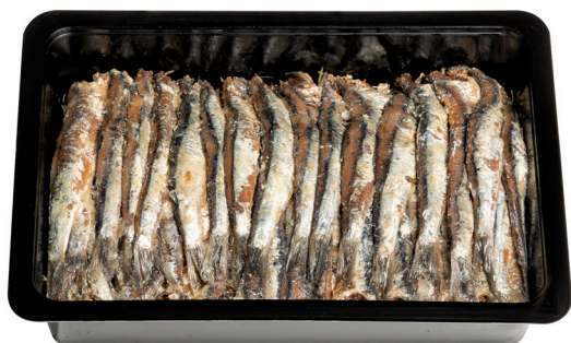
Αντσούγια ακέφαλη παστή Salted headless anchovy Gesalzene kopflose Anchovies Anchois sans tête salé Acciuga senza testa salata