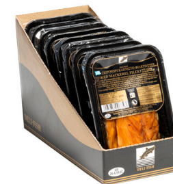
Σκουμπρί καπνιστό φιλέτο Cold Smoked mackerel fillet Geräucherte makrelenfilets Filets de maquereau fumé Filetti di sgombro affumicato