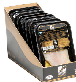
Φιλέτα λακέρδας λευκού τόνου Salted white meat tuna fillet Gesalzene Thunfischfilets Lakerda de thon blanc salé Fette di tonno bianco salate