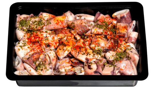
Καλαμαράκι μαρινάτο Marinated squid with parsley Kalmare marinierter Calamar mariné Calamari marinati