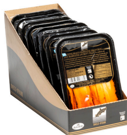
Πικάντικα φιλετάκια γαύρου μαρινάτου Marinated spicy anchovy fillets Sardellenfilets in pikanter Soße Filets d'anchois en sauce pi- quante Filetti di alici marinati in salsa piccante