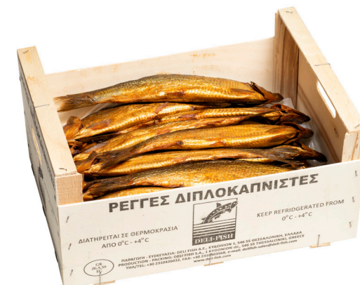
Ρέγγα ολόκληρη καπνιστή Double smoked whole herring Ganzer geräucherter Hering Hareng fumé Aringa affumicata