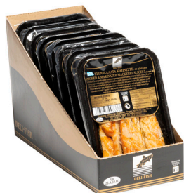
Τσιροσαλάτα καπνιστή Smoked "Tsiros" Geräucherte Makrelenstücke Tranches de maquereau fumé mariné Fette di sgombro affumicato marinato